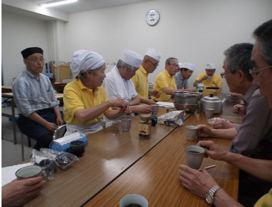
朝のミーティング